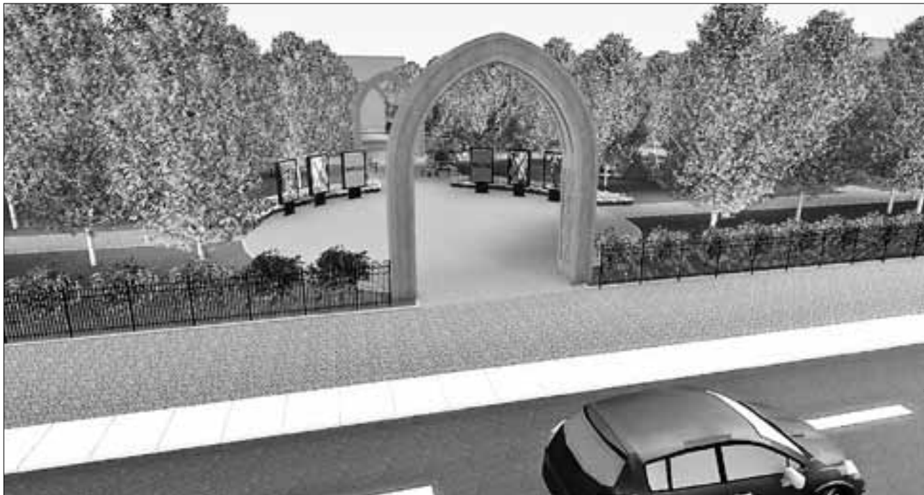
ПРОЕКТ РАЗРАБОТАН ЦЕНТРОМ «СОЛОМБАЛА-АРТ»