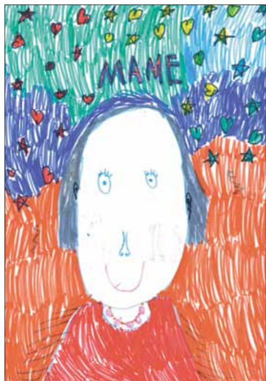
Лера Гладышева, 5 лет, детский сад № 157 «Сиверко»

Сегодня мы публикуем работы участников конкурса детских рисунков, посвященного 8 Марта. Итоги мы подведем в следующем номере