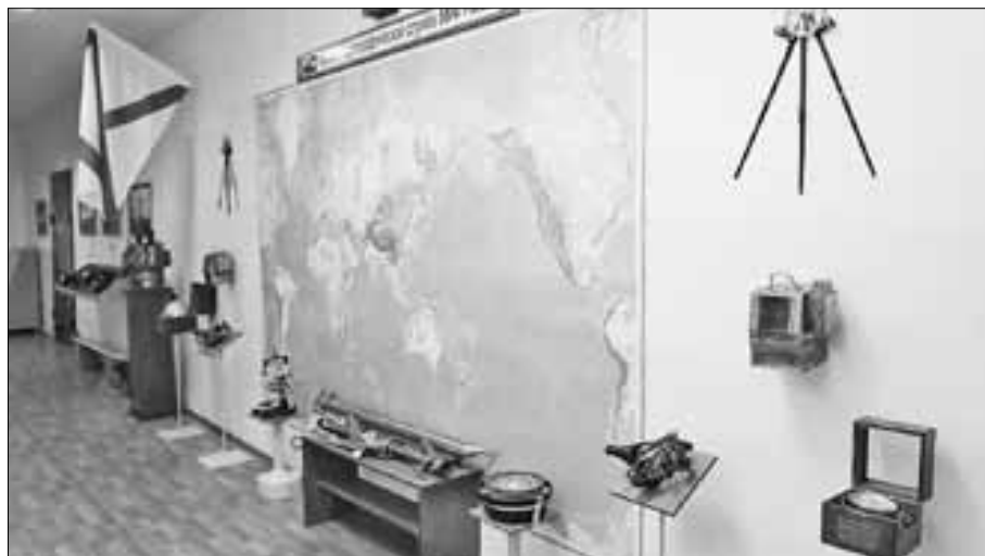
■ В музее гидрографии собраны редкие экспонаты