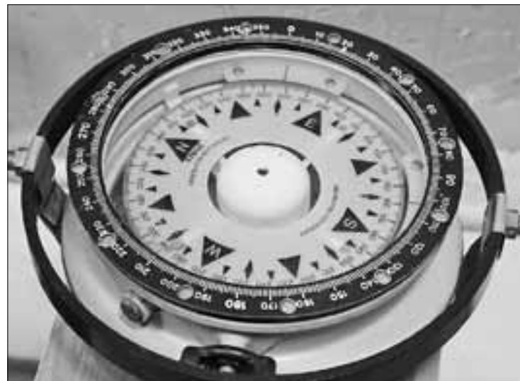
■ Проверенный временем компас

– У нас, действительно, раритет, – заведующая типографией