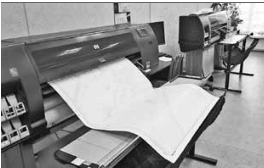
■ Современные карты распечатывают на плоттерах