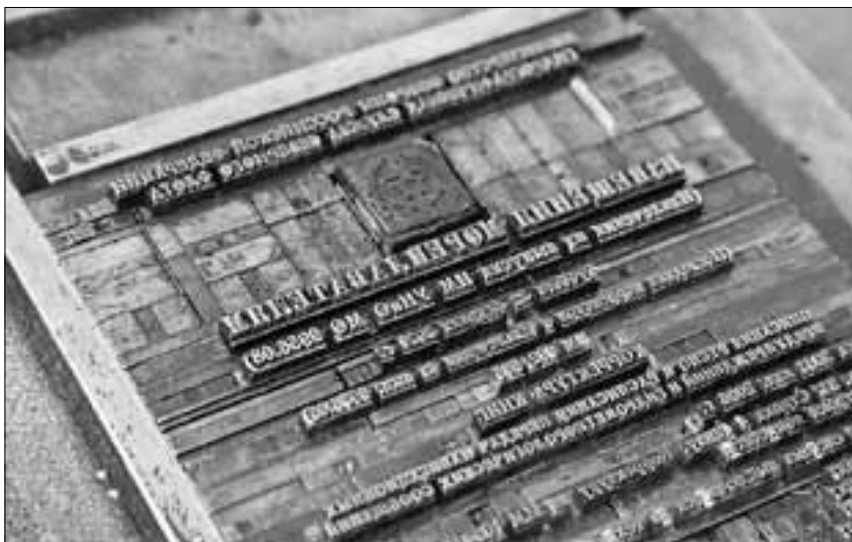
■ Каждый знак вручную укладывается в наборную пластину