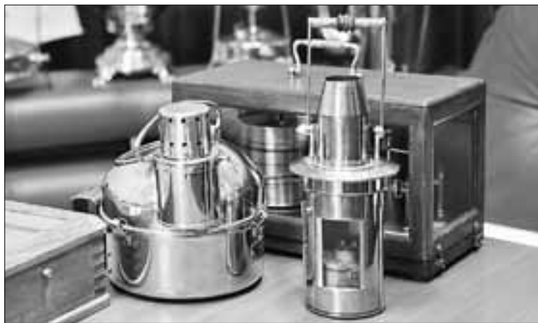
■ Раритеты, напоминающие о прошлом