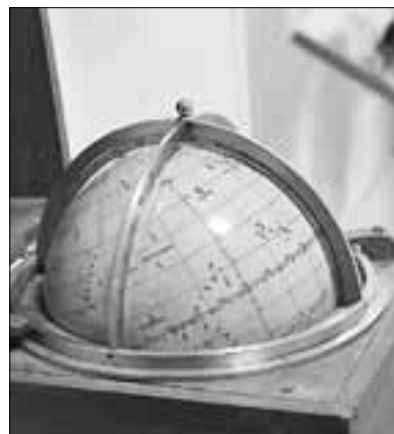
■ Когда-то такое оборудование верой и правдой служило морякам. Теперь многое из этого можно увидеть только в музеях