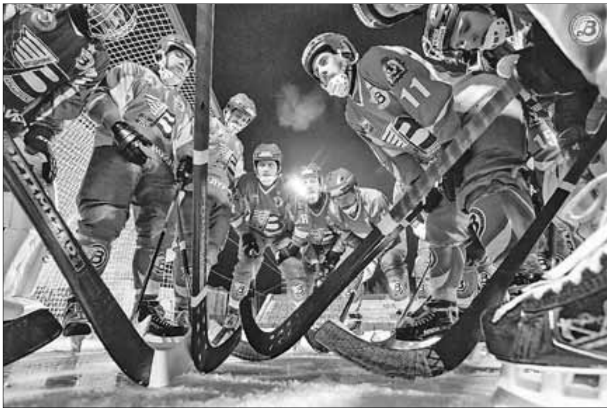
■ «Водник» – настрой на матч.