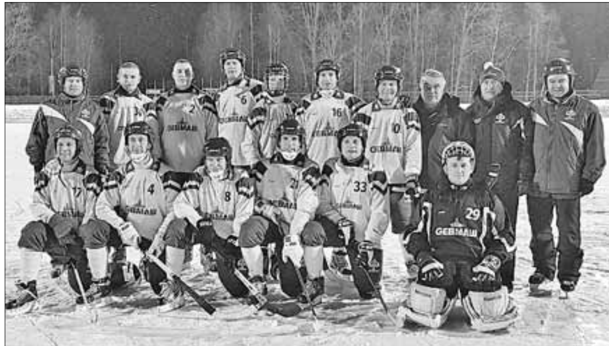
■ ХК «Севмаш» – чемпион Поморья по хоккею с мячом.

Очередного успеха на областном уровне добились хоккеисты северодвинского «Севмаша», которые вновь завоевали золотые медали чемпионата Поморья. Одержав победы над «Водником-2004» – 4:3 и земляками из команды «Северодвинск» – 7:0, сеvmашевцы стали недосягаемыми для соперников. Новоиспеченным чемпионам области осталось провести всего два поединка: в Плесеке с «Юностью» и в Архангельске с «Северной Двиной». Добавим, что по ходу турнира команда Сергея Щукина не потеряла еще ни одного очка. Что касается серебряных и бронзовых наград, их в оставшихся играх разыграют между собой три коллектива из областного центра: «Северная Двина», «Водник-2003» и «Водник-2004». Хоккейный сезон в России и Поморье продолжается.